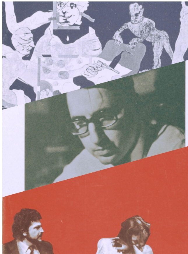
Εικαστικό έργο/εξώφυλλο: Ηρώ Τζιντρούδη-Γαϊτανίδη

Μετά το πέρας του συνεδρίου θα ακολουθήσει κέρασμα